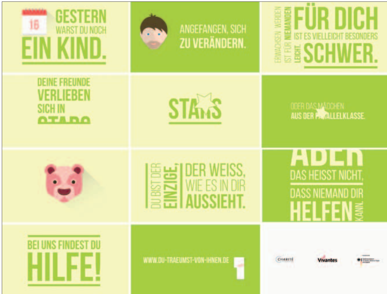
Abb. 2: Screenshots des deutschen PPJ-Projektspots. Zu den einzelnen Frames wird folgender Text gesprochen: „Gestern warst du noch ein Kind. Doch irgendwann hat Dein Körper angefangen, sich zu verändern. Und mit ihm Deine Gefühle. Erwachsenwerden ist für niemanden leicht. Für Dich ist es vielleicht besonders schwer. Deine Freunde verlieben sich in Stars oder das Mädchen aus der Parallelklasse. Doch Du stehst auf Kinder. Du bist der einzige, der weiß, wie es in Dir aussieht. Aber das heißt nicht, dass niemand Dir helfen kann. Bei uns findest Du Hilfe. Kostenlos und unter Schweigepflicht.“

Freiwillig hilfesuchende Jugendliche und/oder ihre erziehungs- bzw. sorgeberechtigten Bezugspersonen können telefonisch sowie via E-Mail Kontakt zum PPJ aufnehmen. Bei einem erfolgten Erstkontakt wird eine persönliche Identifikationsnummer (PIN) vergeben, um die Vertraulichkeit zu gewährleisten. Alle zu dem Jugendlichen erhobenen Daten werden unter dieser PIN geführt. Beim Erstkontakt werden je nach Auskunftsbereitschaft der Grund der Kontaktaufnahme, das Alter und Geschlecht des Projektinteressenten, bereits erfolgtes sexuell grenzverletzendes Verhalten (sexueller Kindesmissbrauch und/oder Nutzung von Missbrauchsabbildungen) sowie der aktuelle Justizstatus einschließlich möglicher vorliegender Anzeigen oder Strafverfahren bzw. Auflagen aufgrund einschlägiger Delikte exploriert. Im Anschluss erfolgt die Einladung zu einem Erstgespräch mit dem Jugendlichen und – je nach Möglichkeit – den Eltern bzw. Erziehungs-/Sorgeberechtigten.