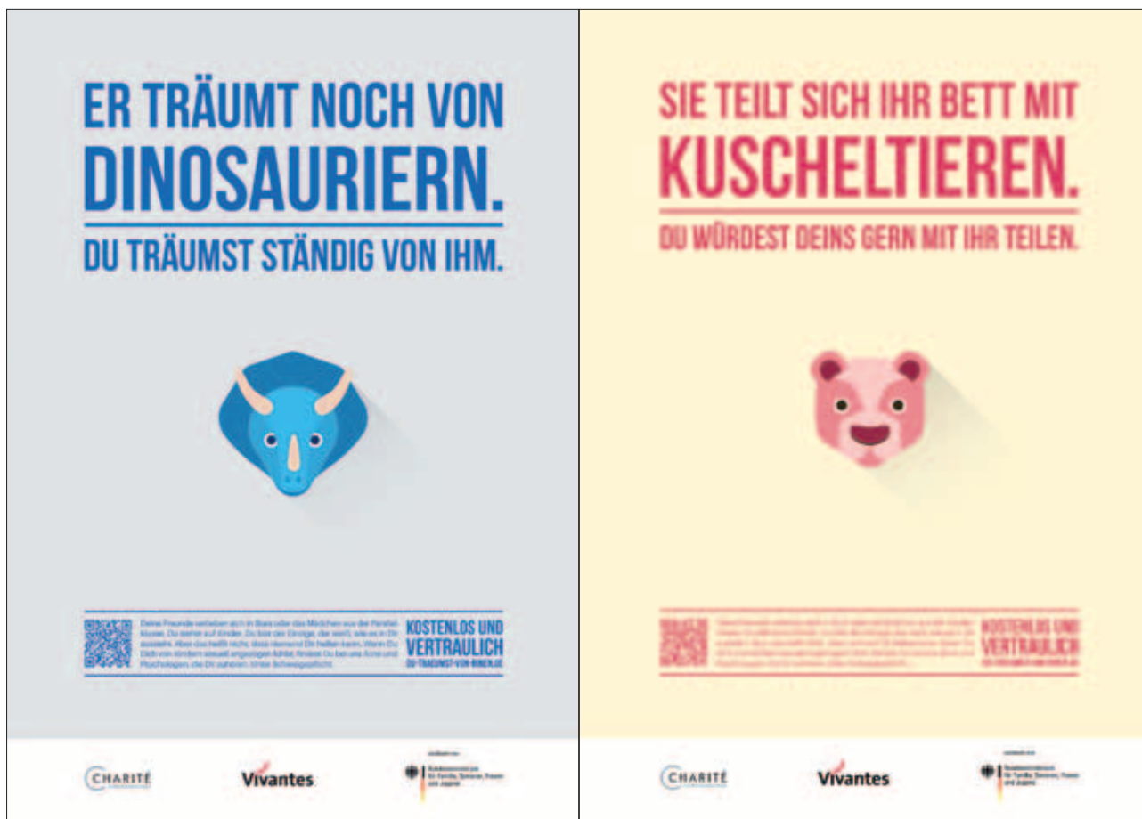
Abb. 1: Das Motivpaar „Dinosaurier/Teddybär“ der Medienkampagne des PPJ

entwickelt. Um eine entsprechende Kohärenz zu gewährleisten, wurde auch der Spot ikonografisch gehalten und in Anlehnung an die Plakatt motive gestaltet (s. Abb. 2). Die Idee eines Werbespots beruht auch auf Erfahrungen im Projekt Kein-Täter-werden (PPD), welches mit zwei Spots in der Öffentlichkeit vertreten ist und dafür durchgängig positive Rückmeldung erfährt. Im Übrigen ließ sich im PPD feststellen, dass Klienten zunehmend über die Projekts pots aufmerksam und daraufhin am Institut vorstellig werden. Diese Wirkung soll auch für das PPJ erreicht werden, insbesondere durch eine Verbreitung des Spots im Internet.