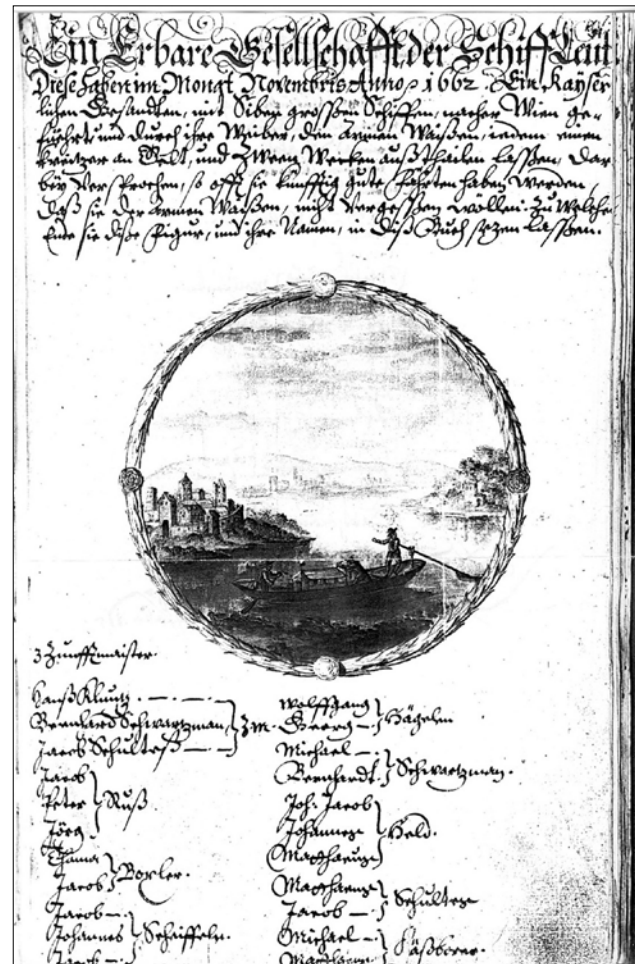
Abb. 3 Abbildung der Donaufahrt im November 1662 mit kaiserlichen Gesandten

Das Besondere aber war, und hier muß auch eine stille Übereinkunft nicht nur innerhalb der Zunft, sondern auch seitens der Obrigkeit und der Kirche geherrscht haben, dass voreheliche Sexualität offensichtlich nur Mitgliedern der Schiffeleute gestattet war! Der Grund hierfür läßt sich leicht in den Arbeitsbedingungen finden. Gehörten die Schiffer doch zu den wenigen, die ihr Auskommen fern der Heimatstadt finden mußten. Selbst Außenhandeltreibende waren nicht mit dieser Regelmäßigkeit unterwegs, und wenn, dann wohl meist auch nicht so lange. Die Fahrten auf der Donau, die in manchen Fällen sogar bis ins Schwarze Meer führten, dauerten Wochen und Monate und selbst die „normale“ Tour bis Wien (StadtA Ulm) 10 , Budapest