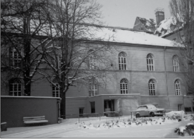
Abb. 5 Das frühere Gebäude des Institutes für Experimentelle Endokrinologie

of metabolism“ – wie AGS, Phenylketonurie u. a. – und rechtzeitige Korrektur hierbei vorliegender, primär genetisch bedingter anormaler Konzentration von Hormonen, Neurotransmittern und Zytokinen.