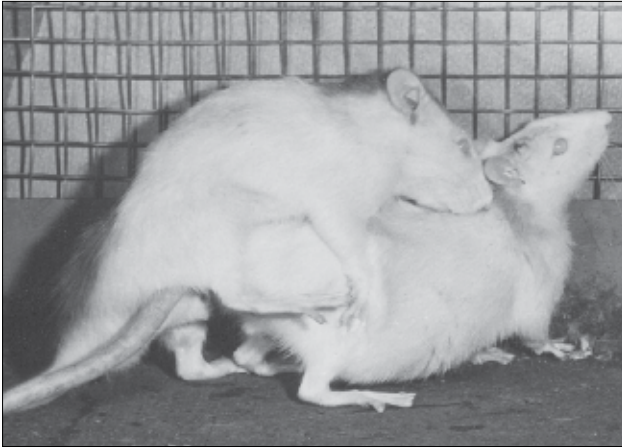
Abb. 3 Umkehr sexualtypischen Verhaltens im Tierexperiment

infolge von Kastration kurz nach der Geburt später unter Testosteronzufuhr ein typisch rein weibliches Verhalten mit Lordose aufwies.