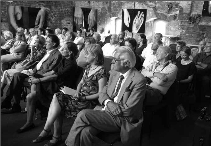
Blick auf den Veranstaltungsort: Hörsaal-Ruine des Medizinhistorischen Museums des Universitätsklinikums Charité, Campus Mitte