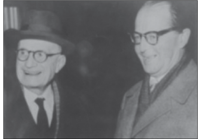
Abb. 2 Selmar Aschheim und Walter Hohlweg

In Abb. 2 sind Selmar Aschheim und Walter Hohlweg dargestellt. Die Aufnahme stammt aus dem Jahre 1960, als Aschheim anlässlich der 250-Jahrfeier der Charité die Ehrendoktorwürde der Humboldt-Universität verliehen bekam. Später erhielt auch Hohlweg den Ehrendoktor der Humboldt-Universität.